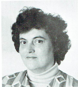
Majken Vinberg Tapetmaskin, Novalin