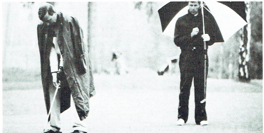
I ur och skur