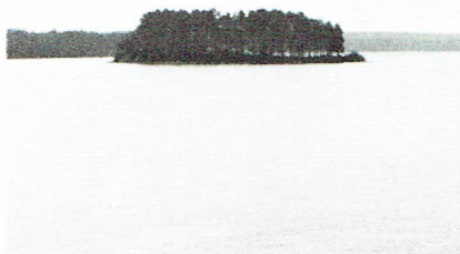
En ö i Siljan, med gravfält från vikingatiden

Tidigt nästa morgon gör vi oss klara för avfärd till båthamnen, där vi går ombord på M/S "Gustaf Wasa", byggd 1876 och renoverad 1964, för en 4 timmars sjötur på Siljan. I strålände sol och med svag bris seglar vi utmed Österdalsälven, rundar udden vid Leksands kyrka