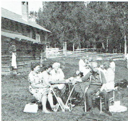
Kaffestund på fåbodvallen

Jobs får vi beundra de vackra, berömda textiltrycken och en inblick i tryckeriverkstaden. Vid en annan liten "gattu" = gata, finner vi keramik vid sin drejskiva. Konsthantverken blomstrar i dessa bygder, här är inget stress och hets och tiden tycks nästan stå stilla.