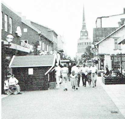
"Gågatan" i Mora

görs för hand. Den östra sidan av Siljanbygden erbjuder oss ett fantastiskt panorama med underbar utsikt över sjön, att man blir helt betagen. Nere i Rättvik stannar vi till en stund för att se på de gråa kyrkstallarna, 89 till antalet, samt en titt in i kyrkan, där en ung organist övar "Den signade dag. . ." till helgens högmässa. Nu har vi endast 2 mil kvar till Leksand och raskt kör vi genom de små samhällena och litet på avstånd kan man se Sjugare, en liten by med röda stugor, vackert belägen vid en sjö och vi minns E A Karlfeldt och hans "Kulla, med mandelblommans hy"