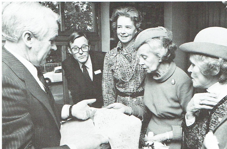
Prinsessan Lilian beundrar en dessin ur Kinnasands kollektion.

Prinsen och prinsessan ägnade förhållandevis lång tid åt ett besök i Kinnasands monter och prinsessan Lilian förkortade t.o.m. sin lunch för att kunna besöka oss en andra gång och titta på våra produkter, där hon särskilt beundrade våra nyheter Kasper, Jesper och Jonatan. Dessa artiklar måste appellera till kunglig smak, eftersom vårt Stockholmskontor håller på att för-