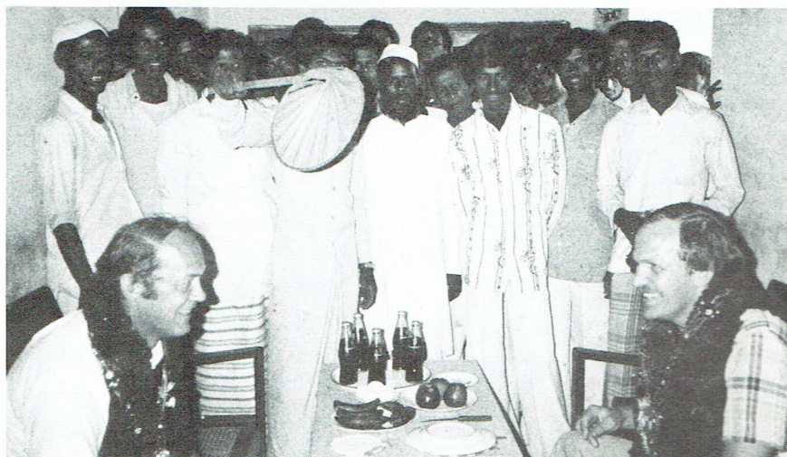
Nyfikenheten runt "lunchbordet" bidrog inte till att aptiten ökade

Produktion av trasmattor och rörlakan tillgår så att man trär (väften) trasor och garner mellan varptrådarna för hand eftersom skyttel saknas. Istället för sked, som man normalt slår samman väften med, används en punja (det är ett litet gaffelliknande verktyg) för att slå ihop trasorna alt. garnerna med så att i detta fallet matorna blir fasta och bra. De kan producera mellan 1—2m 2 /dag under normala förhållanden men under