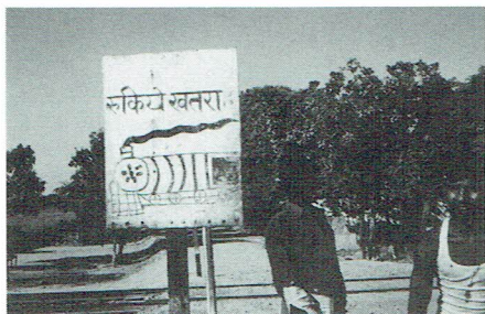
Varning för tåget med indiskt perspektiv.

Frukosten övergår i förberedelser för resan av dagen. Packning för bilfärd ut till byarna. Så här års kan det bli mellan 35—45 grader Celsius i skuggan och mycket torrt. Man måste ha en handduk med sig för att hålla mot mun och näsa som skydd för dammet. Dammet viner in i bilen p.g.a. att vi måste köra med neddragna fönster för att över huvudtaget få någon fläkt. Akterut är det däremot sjöblött. De sköna syntetskinneklädselarna i sätena gör att man direkt drabbas av rejäl aktersvettning.