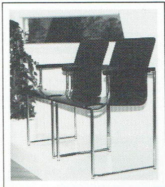
En av stolarna i JOC-programmet.