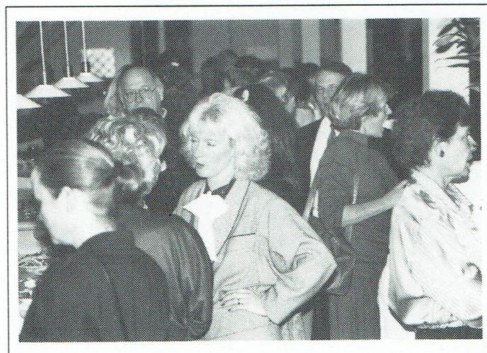
Folk i vimlet, över 300 personer kom till Bastionen.