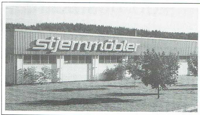
Stjernmöbler kommer att ingå i Horreds Hem.