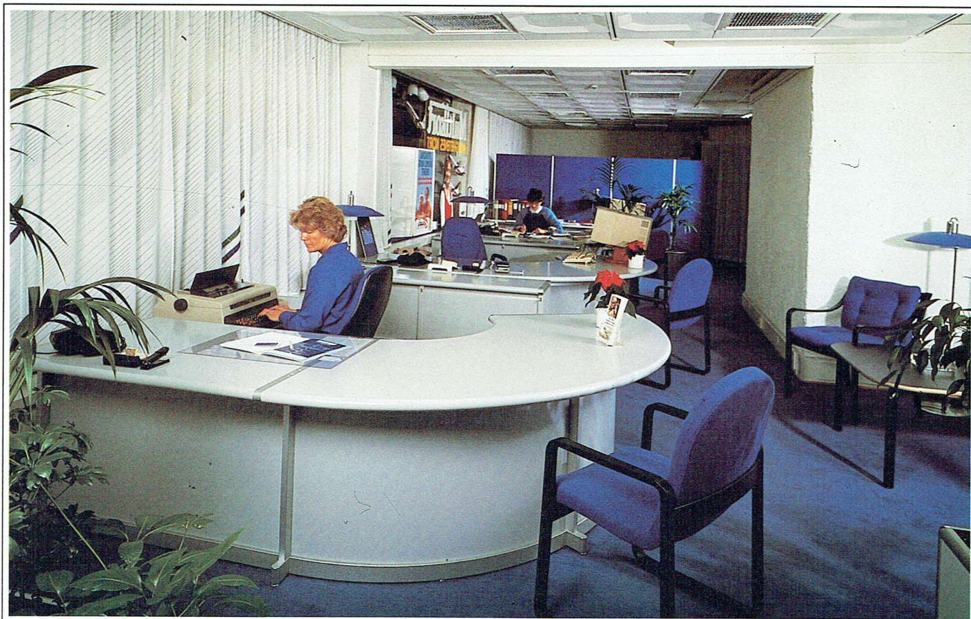
ROUND OFFICE ORIGINAL