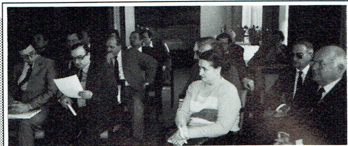
Många kom och lyssnade, tittade, nickade och begav sig hem för att fundera efter visningarna i Leningrad.