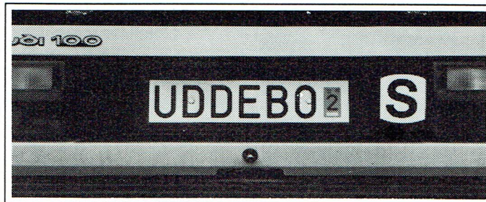
Uddebo annonserar numera globalt.

torn utsätts för en allt mer påfallande importkonkurrens. - att antalet provkollektioner (och storlekar) ökar lavinartat. Detta är i och för sig en naturlig följd av intensiv marknadsbearbetning, så låt oss hoppas och tro att sådd och skörd står i vettig proportion.