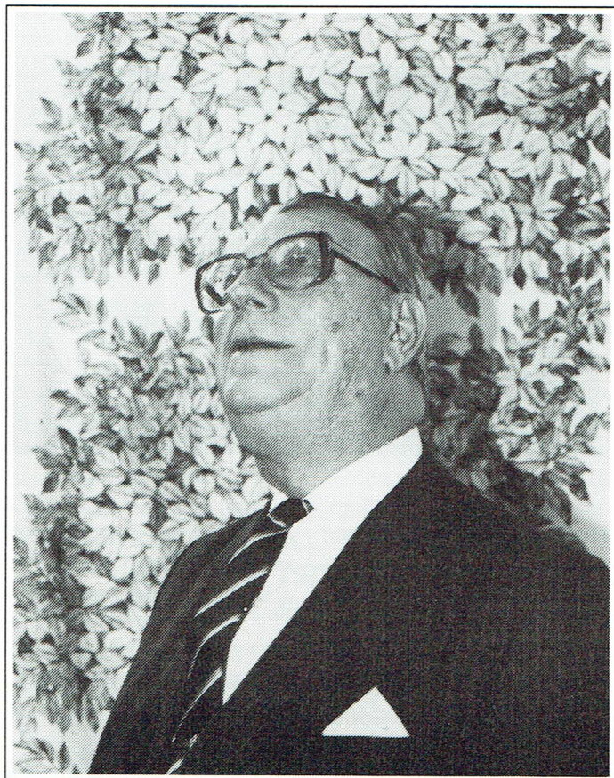
Landshövding Åke Norling lyfter sitt huvud i beundran.