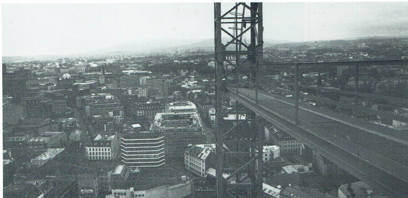
En magnifik utsikt ut mot Oslofjorden (övre bilden) eller upp mot Holmenkollen ut över Oslo stad.