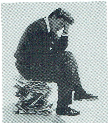
Bilden hämtad ur en av våra annonser med rubrik: Möbelkataloger i all ära, men det blir svårt att provsitta.